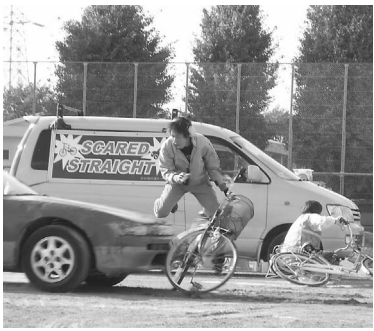
高齢者の交通事故が増加しています