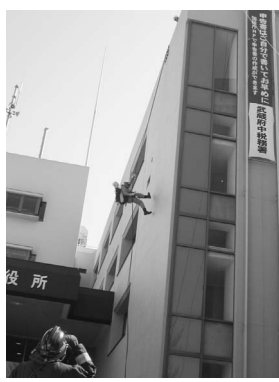
屋上からの降下訓練