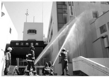
市役所庁舎への一斉放水