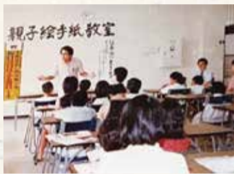
狛江郵便局で開かれた全国初の「親子絵手紙教室」=1981年夏

◆次回は絵手紙愛好者の全国組織「日本絵手紙協会創設の話」。(聞き手 元新聞記者・佐藤清孝)