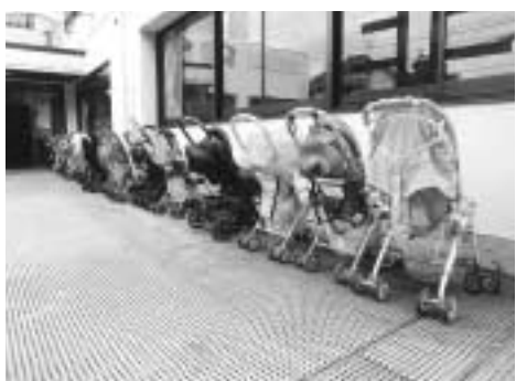
岩戸児童センター

中央図書館 (3488)4414 子どもおはなし会 2日・9日・16日・23日・30日(各水曜日)いずれも午後3時30分から(4歳以上の子ども) 親子で楽しむおはなし会 10日・24日(各木曜日)(0～1歳の子どもの保護者)午前10時30分～10時45分(2～3歳の子どもの保護者)午前11時～11時20分