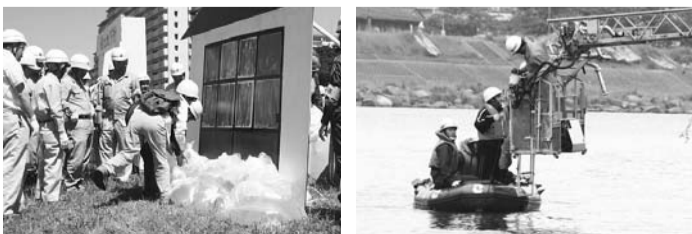
昨年の水防訓練の様子。市民の皆さんには、左下写真の都市型水防工法に参加していただきます。

害対策として、特に集中豪雨などにより、地下室等建物内に浸水するのを防止する対策として、家庭にある部材等(ブレンダー、ポリタンク、段ボール等)を活用した床上浸水防止策等、いざという時に大役役立つ内容となっています。市民の皆さんの多数のご参加、訓練への参加をお願いします。なお、訓練への市民の皆さんの参加申し込み(定員50人)を受け付けます。 〔日時〕 5月27日(土)午前9時～正午ごろ 〔会場〕 多摩川河川敷(猪方四丁目2番地先) 〔実施機関〕 狛江市、狛江市消防署、狛江市消防団 〔参加協力団体〕 狛江市建設業協会、狛江市防災会、災害時支援ボランティア、女性防火の会 〔申し込み・問い合わせ〕 22日(月)までに総務防災課へ。