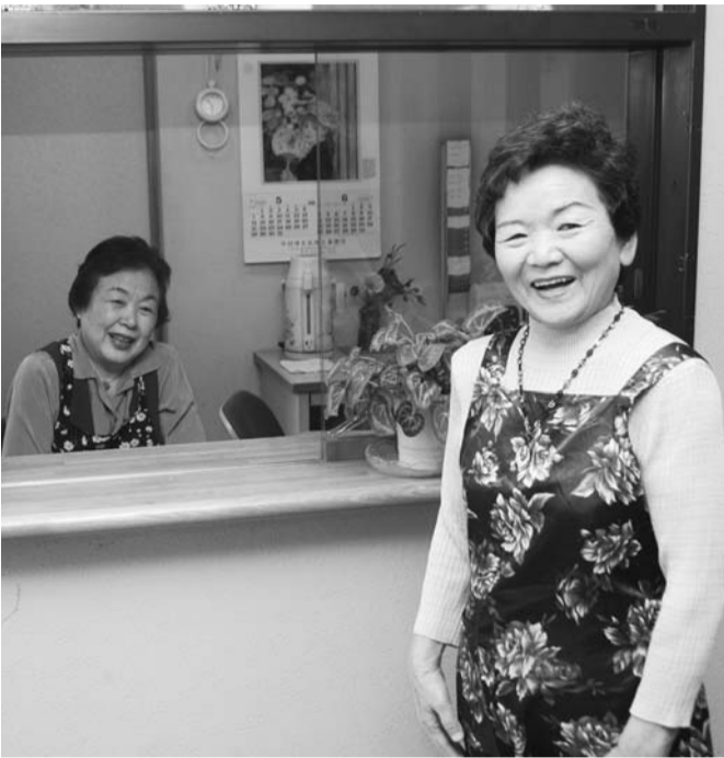
施設窓口で活躍する会員「老人福祉センター」入口で皆さんをお待ちしています

説明会に参加していただき、後日入会手続きを行います。日程は、お問い合わせください。 〔会費〕年額1,000円