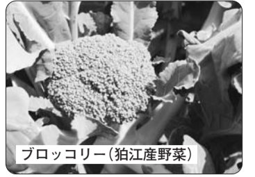
ブロッコリー(狛江産野菜)

◎発行/東京都狛江市 ◎編集/総務部情報課 〒201-8585 狛江市和泉本町一丁目1番5号 ☎(3430)1111 ホームページアドレス http://www.city.komae.tokyo.jp