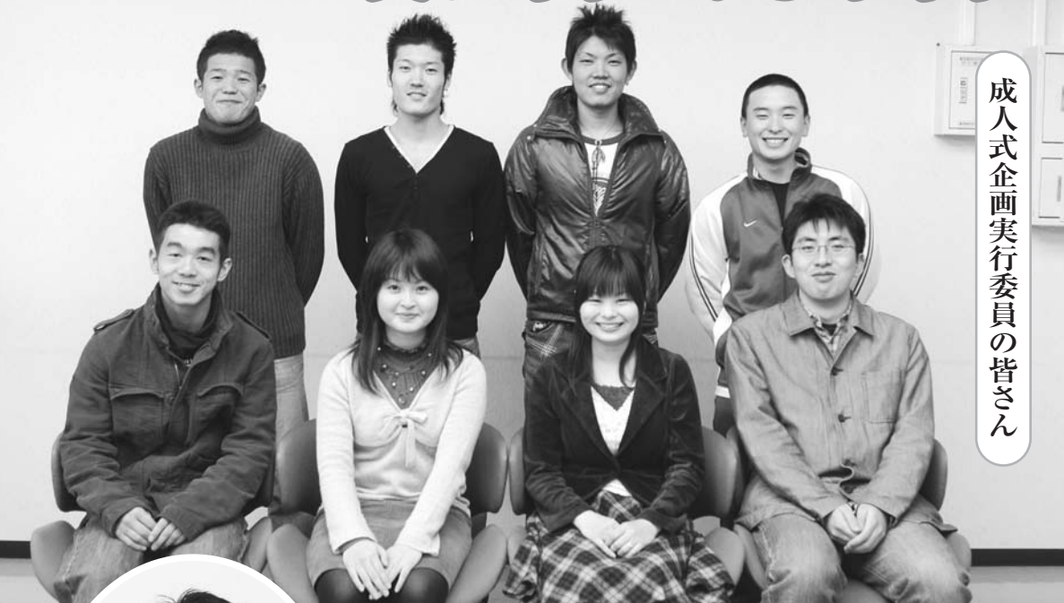
成人式企画実行委員の皆さん