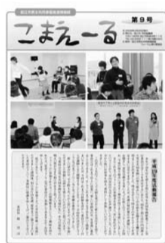
情報紙「こまえーる」第9号を発行しました

このフォーラムの企画、立案を行う市民を募集します。少しでも興味を持たれた方は、ぜひお問い合わせください。