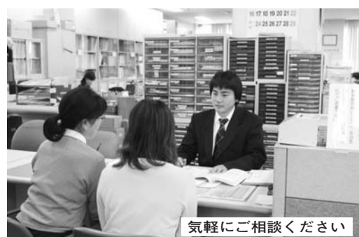
気軽にご相談ください