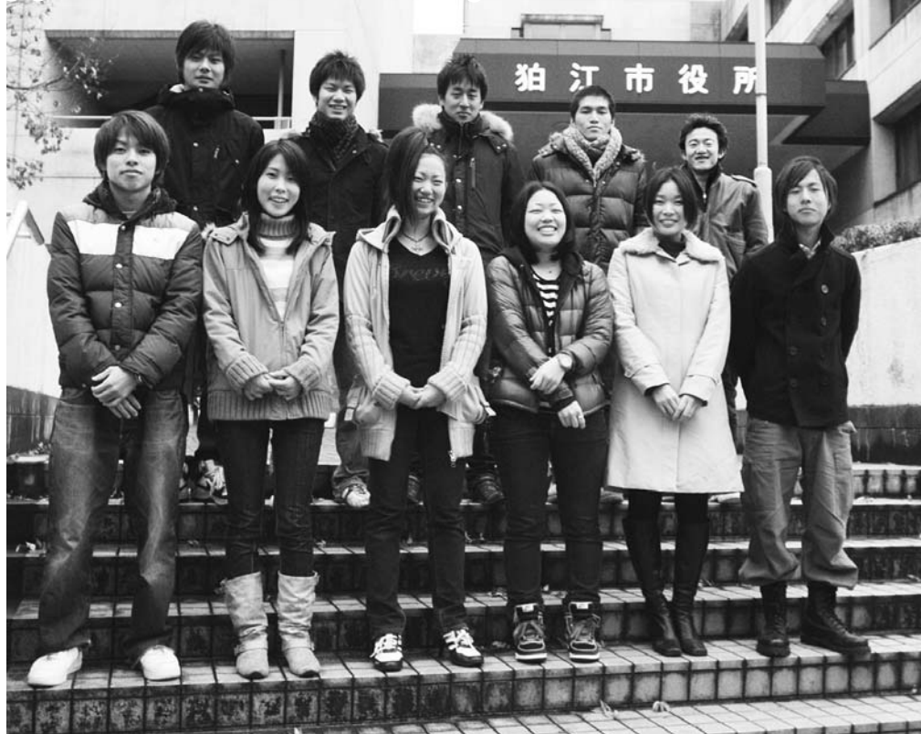
成人式企画実行委員の皆さん

昭和63年4月2日から平成元年4月1日生まれまでの方を対象に、成人式を開催します。 案内状は12月初旬に郵送しています。届いていない方は、連絡ください。 新成人で企画実行委員会を立ち上げ、一生に一度の成人式を思い出に残るものにするため、会議を重ねています。 皆さんでお誘いあわせの上、参加ください。 〔式典〕午前11時〜11時45分 (アトラクション) 午前11時45分〜午後2時30分 (問い合わせ) 児童青少年課 児童青少年係