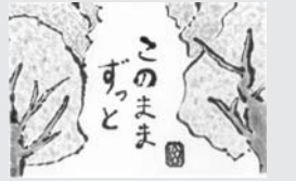
第五小学校卒業生の作品

◆演奏会・コンサート ▽12日(木)午後1時から 「詩吟」 岳窓会 ▽13日(金)午後1時30分から 狛江マンドリンギタークラブ ▽13日(金)午後2時から 「歌声喫茶」 狛江ぞう列車合唱団 ▽14日(土)午前10時30分～午後3時 「つどいコンサート」 カプア・フラ・グループ、狛江ハーモニカ愛好会、狛江韓国語同好会、岳窓会、美重駒会、貞山会 ◆講習会 ▽13日(金)午前10時～午後4時 狛江市ときわ婦人会「マジックタワシ」