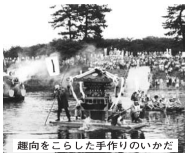
趣向をこらした手作りのいかだ

多摩川の夏の風物詩「多摩川いかだレース」は職場の仲間や友人たちとチームを結成し、手作りのいかだでスピードやアイデアを競うもので、今年で19回目の開催となります。市民有志による実行委員会で実施・運営され、財政的にも自立していることは特筆に値します。推薦してください。方のコメントを紹介し「実行委員会ではレースを単なる一過性のイベントで終わらせるのではなく、市のまちづくりのコンセプトの一つである多摩川を生かしたまちづくりを推進し、