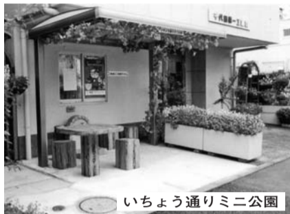
いちよう通りミニ公園

推薦してくださった方のコメントを紹介します。「会社の皆さんのお手入れにより、いつも気持ち良い場所になっています。そして、テーブルといすが加わり、ますますすてきなところとお休みさせていたただこうと思っています。」