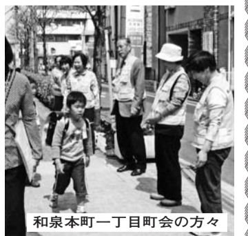
和泉本町一丁目町会の方々

パトロールを継続するためには、無理をしないことを心掛けています。しかし、いざ事件、災害があったから、という付け焼刃では役には立ちません。