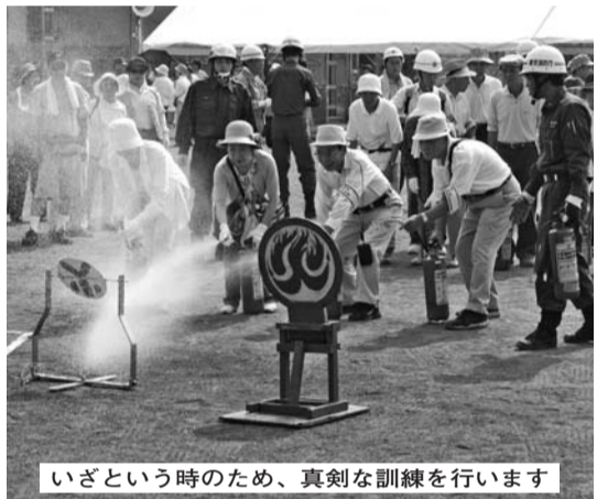
いざという時のため、真剣な訓練を行います