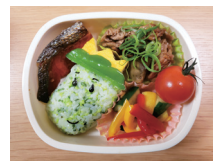
えだまめ王子弁当

▽キャラクター弁当部門 展示期間 2月20日(水)～3月18日(月) 申請 1月16日(水)から2月4日(月)までに、応募用紙(中央図書館窓口で配布)を中央図書館 ☎(3488)4414へ。 えだまめ王子弁当