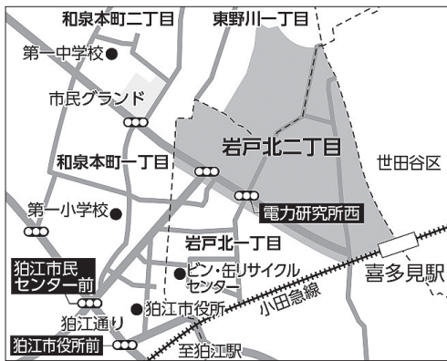
■岩戸北二丁目周辺地区対象地