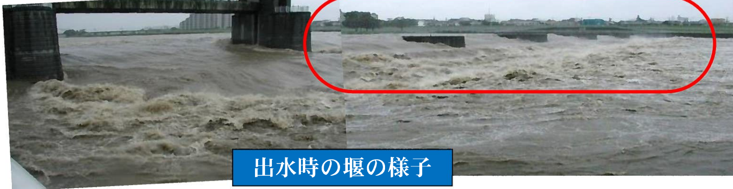
出水時の堰の様子