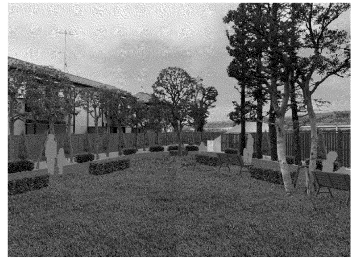
整備イメージ(中央芝生広場から南東方向のようす)