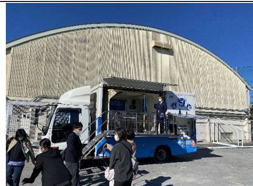
起震車(スターツ株)