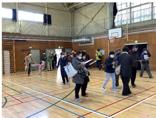
避難者検温・問診 (狛江第三小学校)