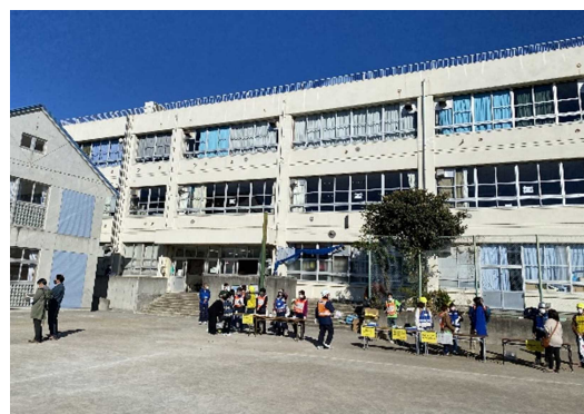
避難者受付 (狛江第四中学校)