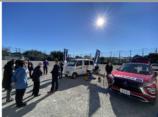
電気自動車からの給電