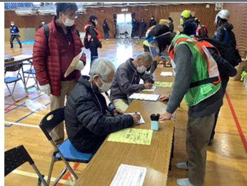
避難所運営協議会による避難者に対する説明 (狛江第三中学校)