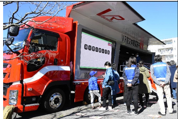
V R 防災体験車