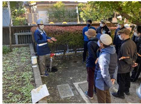
応急給水栓の説明