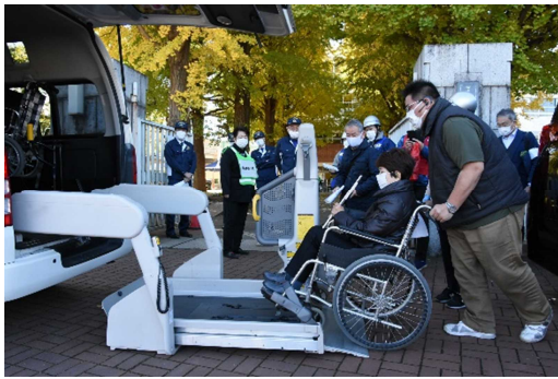
介護タクシーによる要配慮者の移送