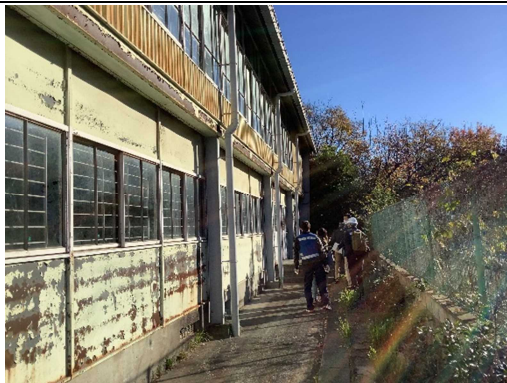
避難所開設準備状況 (狛江第一小学校)