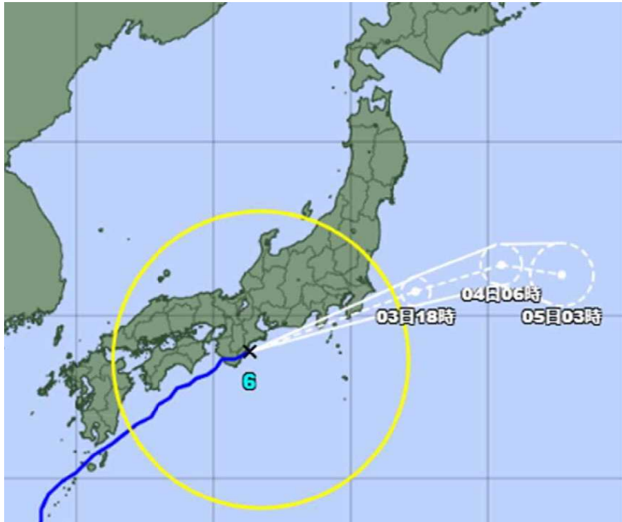
気象庁情報（3日7時現在）